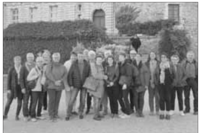
vor dem Chateau Brissac-Quincé

Am Donnerstag, 3. Oktober, startete eine 9-köpfige Delegation des Partnerschaftsvereins Ichenhausen in Richtung Frankreich.