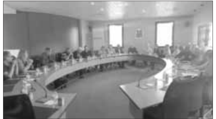
bei der Arbeitssitzung