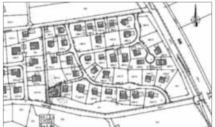
Übersichtslageplan Bebauungsplan „Am Maderweg, 3. Änderung“, unmaßstäblich

Der Geltungsbereich der Änderung betrifft das Grundstück Flur-Nr. 492, Gem. Ellzee, sowie eine Teilfläche des Grundstücks Flur-Nr. 494, Gem. Ellzee.