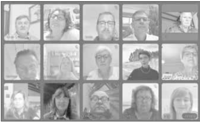
Das Foto von Karl Heinz Schiller zeigt die Teilnehmer des virtuellen Treffens.