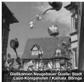
Gießkannen Neugebauer