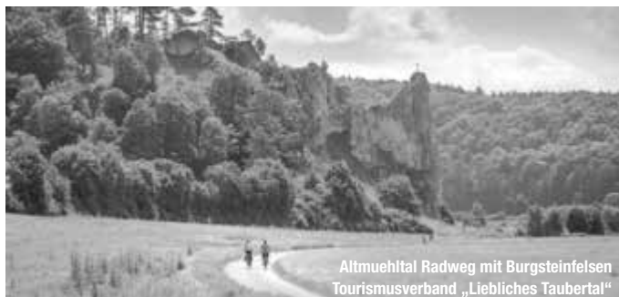
Altmuehltal Radweg mit Burgsteinfelsen Tourismusverband „Liebliches Taubertal“

Entspannt radeln, die Naturvielfalt zwischen sonnigen Wacholderheiden, Felstürmen und lichten Wäldern auf verschiedenen Touren erleben und abends immer wieder in derselben gemütlichen Unterkunft ankommen – so ist es vielen Genussradlern am liebsten. Für sie hat der Naturpark Altmühltal, die abwechslungsreiche Radregion in der Mitte Bayerns, jetzt 15 neue Rundtouren konzipiert, die in der druckfrisch erhältlichen Karte „Radtouren – Tourenvielfalt und Altmühltal-Radweg erfahren“ verzeichnet sind. treffpunktdeutschland.de/altmuehltal