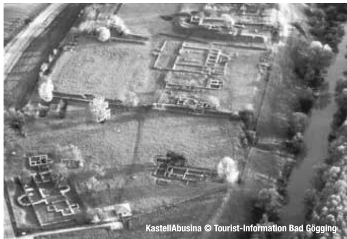
Kastell Abusina

Kunst und Kultur, Handel und Handwerk, Badeanlagen, Schwitzkuren und modernes Denken – all das brachten die Römer im 1. Jahrhundert nach Christus mit auf ihrem Weg zur Donau. Erst kürzlich wurde der Donau-Limes von Bayern, Österreich und der Slowakei zum UNESCO-Welterbe erklärt. Vielfältig und beeindruckend sind die Spuren, welche die Eroberer aus dem Süden in Ostbayern hinterlassen haben. Neben Kelheim, Regensburg, Straubing, Künzing und Passau bietet auch Bad Gögging mit der Limes-Therme faszinierende Einblicke in das Alltagsleben der Römer. „Geschichte zum Anfassen“ ist das Motto in Abusina, einem der kleinen, stark befestigten Kastelle, von denen aus die Legionäre in der Vergangenheit die Grenzen Roms sicherten.